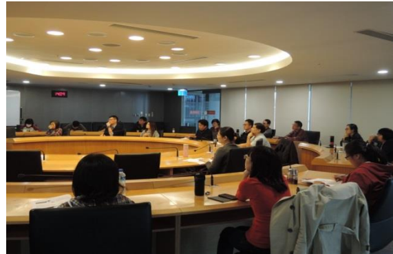
自治條例性別影響評估實際上課情形