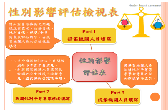
本局自製自治條例性別影響評估教材